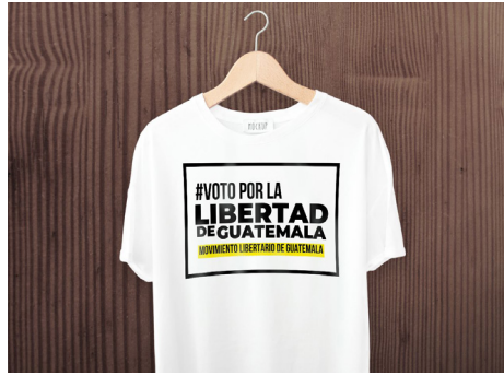
(una muestra alejada del diseño final).